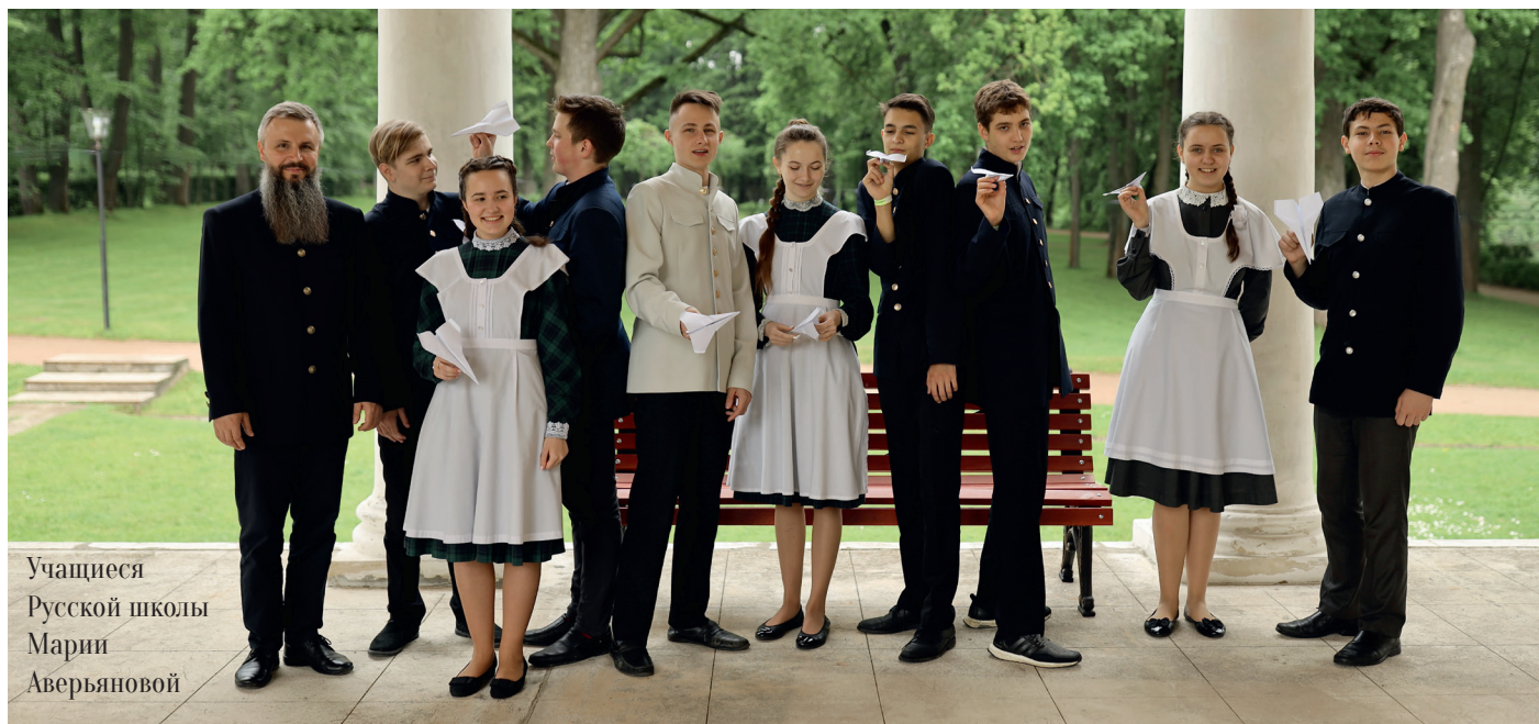
Учащиеся Русской школы Мари Аверьяновой

ЕГЭ как система и как формат погружает в глубокий стресс не только учеников, которые утрачивают желание учиться, но и педагогов. Они вынуждены постоянно отрабатывать новые методики, вести отчетность – это тяжелая, и, по мнению самих педагогов, бесполезная работа, которая дополнительно не оплачивается, что противоречит основным принципам организации труда. Любая дополнительная нагрузка, адаптация и внедрение новых разработок – то, что должно оплачиваться дополнительно. Фактически же, на протяжении последних 18 лет, все тестирование новых программ ложится на плечи педагогов и подводится под обязательную программу. Таким образом, вместо того чтобы качественно и ответственно, на высоком уровне выполнять свои прямые обязанности – учить детей, российские педагоги занимаются внедрением западных образовательных систем. Это серьезный стресс для специалистов, для детей, с которыми они работают, и в комплексе такая ситуация приводит к печальным последствиям, которые можно наблюдать уже сегодня – выросло «поколение ЕГЭ»: люди, не умеющие мыслить, думать, не получающие от процесса обучения удовольствие. Это преступление перед детьми, для которых учеба должна быть интересной, увлекательной.